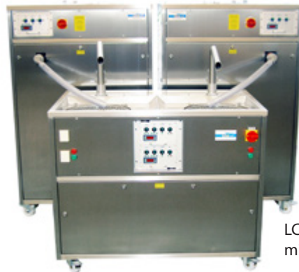
LCM TWIN Temper 40 AT mit 2 x LCM 400 M Auflöser